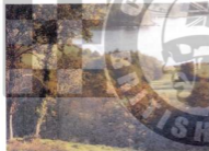
La Suisse Normande