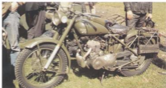
Le prototype n°2 du TWW - remarquable le discret silencieux !

Sa distribution était latérale pour satisfaire les caprices de l'escadron.