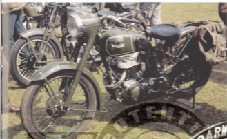
À gauche en loin : Modèle BSA 'Trusty' 101S.